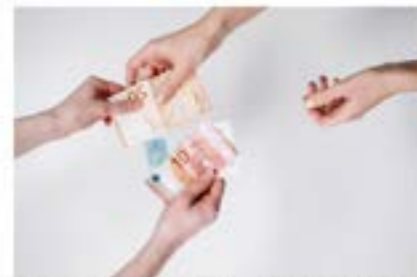
Las agencias de viajes se han quedado en la calle de sus ingresos por no haber cobrado a la compañía aérea por el vuelo que se canceló debido a la crisis del coronavirus. Fuente: www.hosteltur.com

URL: https://www.hosteltur.com/138786_agencias-de-viajes-advierten-que-se-estan-descapitalizando.html