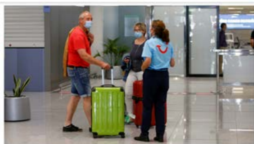
Turistas desfilando por el aeropuerto de Madrid. 15 de julio de 2020.

El turismo es, sin duda, uno de los sectores más afectados por la crisis del coronavirus. Fue una de las primeras víctimas. Incluso antes de que se declarase la pandemia, los gobiernos se apresuraron a cerrar las fronteras. Inicialmente de manera selectiva, después de forma casi total. Comenzaba un tortuoso camino para la industria del turismo. Y el panorama no ha hecho sino empeorar.